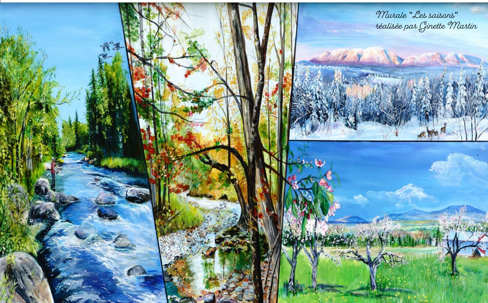
Murale "Les saisons" réalisée par Ginette Martin

2991, chemin Saint-Léon, Val-Racine (Québec) G0Y 1E1 819 657-4790 info@val-racine.com www.val-racine.com